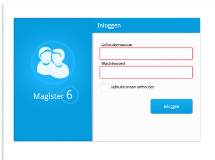
Figuur 01: Inlogschermbild http://reitdiep.magister.net

Krijgt u na het inloggen een scherm te zien met een bonzend M6 logo die niet verdwijnt, leeg dan de cache van uw browser. Op deze site http://www.browserchecker.nl/cache-bestanden-verwijderen staat per browser beschreven hoe u dit doet.