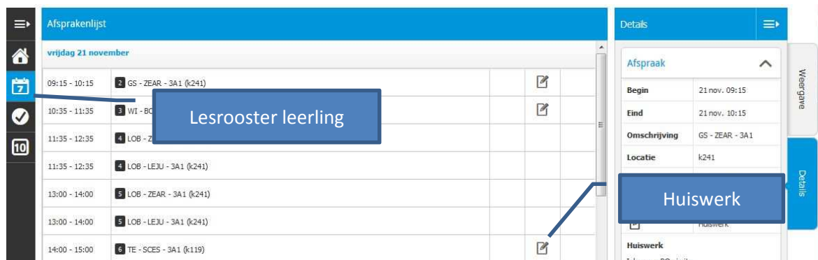
Figuur 03: Agenda leerling

Klikken op de agenda-icoontje geeft u het volgende overzicht: