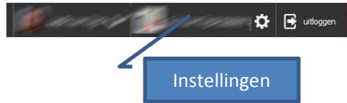
Figuur 12: Overzicht van gegevens ouder

Mijn instellingen geeft een overzicht van de ingelogde ouder van het kind. Mocht er een adres wijziging zijn, laat dit dan zo snel mogelijk aan de school weten. E-mail adres, telefoonnummer en uw wachtwoord kunt U zelf wijzigen.